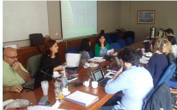
GLOBAL-SPIN Projektin toinen partnerikokous Patraksessa, Kreikassa, 29. syyskuuta 2017, kaikki partnerit paikalla.

tutkimustuloksista, koulutusohjelmasta, joka pohjautuu näihin tutkimustuloksiin, Kansainvälisten yritysten foorumista (TEF) ja EU:n sidosryhmistä. Kokouksessa oli hyvä mahdollisuus kertoa partnereille missä mennään projektissa ja esittää tärkeitä kysymyksiä jatkon kannalta.